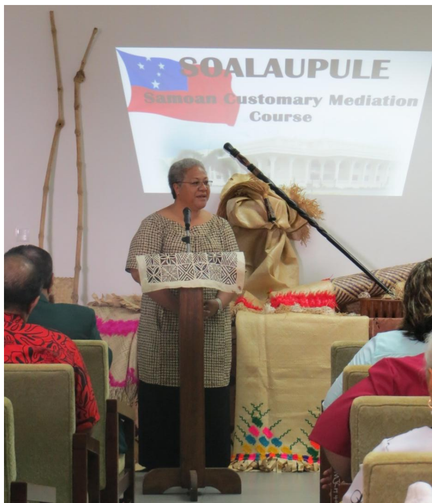
Afioga Fiamē Naomi Mataafa, Minisita o Faamasinoga i lana saunoaga e tatala aloaia ai le aoaoga o le 'Soalaupule' i le aso 11 Iulai 2013.

Saunoa le Minisita, 'O le tele o eleele i Samoa nei o lo o aafia i lalo o le tulafono o eleele faaleaganuu ma o lo o faafoeina e matai, ma e ese le tele o le taua ma le aoga o lea matafaioi.'